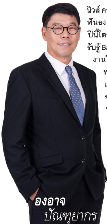
องอาจ ปัทนุยากร

■ ททยอยรับรู้Backlogไม่ขาดมือ ■ ลุยซิงงานใหม่300-400ล้าน